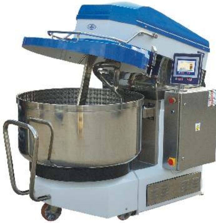
Miesiarki spiralne z dzieżą wyjezdzną typu SMR

Siedziba: 44-100 Gliwice ul. Jana Śliwki 33