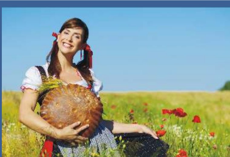
Wrzesień, Październik - Węgry