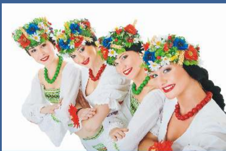
Styczeń, Luty - Ukraina