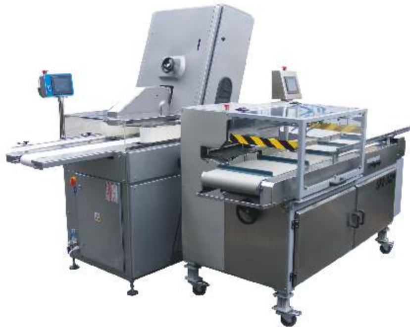
Krajalnica taśmowa wraz z pakowaczką

Siedziba: 44-100 Gliwice ul. Jana Śliwki 33