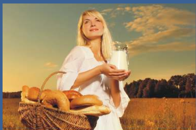
Lipiec, Sierpień - Czechy i Słowacja