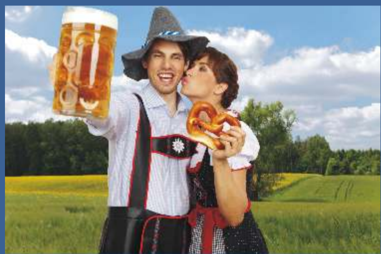
Marzec, Kwiecień - Niemcy