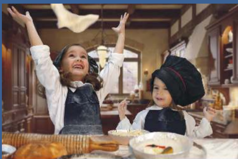
Maj, czerwiec - Anglia